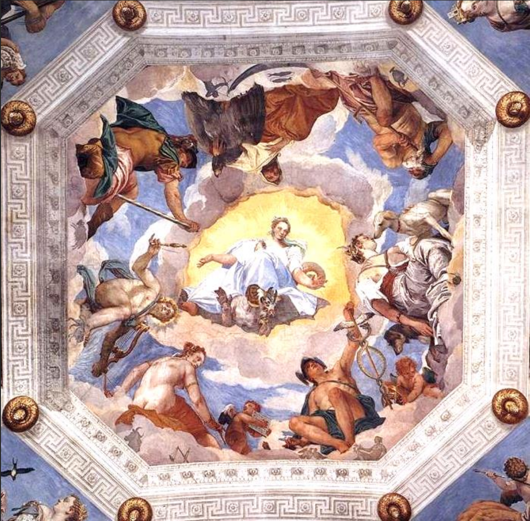
Harmony/Eternity (?) with Mars – Scorpio, Aries; Apollo – Leo; Venus– Taurus, Libra; Mercury – Gemini, Virgo; Luna – Cancer; Saturn – Aquarius, Capricorn; Jupiter – Sagittarius, Pisces